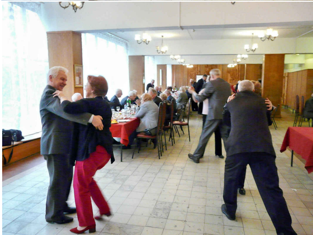
По мнению фотографа Севы Зарубанова : цій не тільки чоловічий танець був не гопак, а "Камаринская"